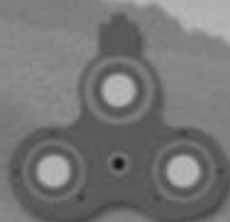
D 99 Trio