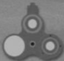
D 99 Duo